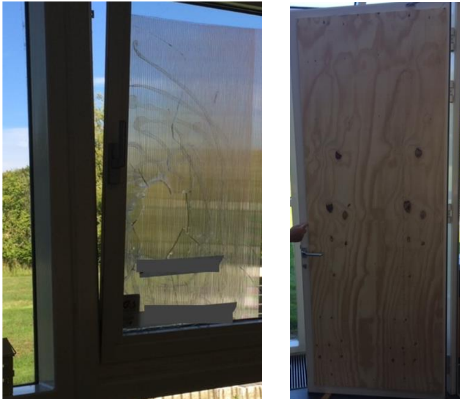
Foto 1. Eksempler på rude og dør, der efter indbrud er afdækket med henholdsvis polycarbonatplade og træplade. Kundens værdier sikres hermed mod vejrliget og yderligere tab.