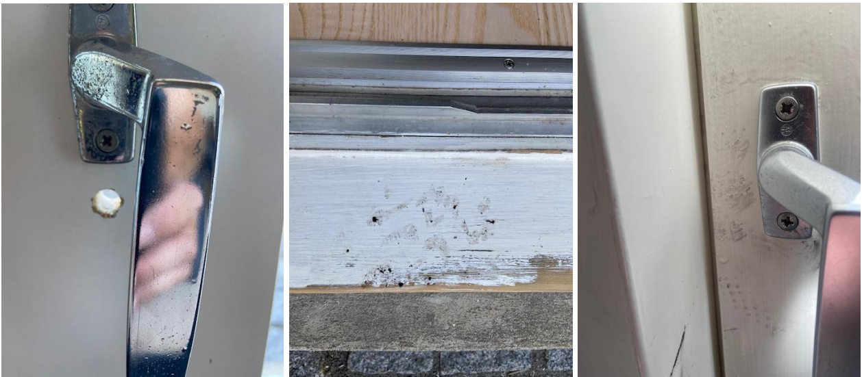
Foto 2. Eksempler på mulige spor. Tv: Boret hul under dørhåndtag (underboring). Midt: Tydelig profil af fodaftryk i terrassedørkarm. Th: Mærker omkring dørhåndtag der muligvis stammer fra prikker fra arbejdshandske.

I relation til at det er en politimæssig opgave at efterforske, nøjes vagten med at videregiver oplysningerne og sikre gerningsstedet.