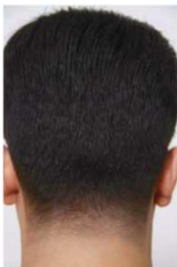
Den færdige frisure bagfra.