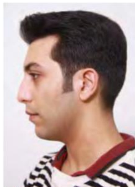
Den færdige frisure i profil.